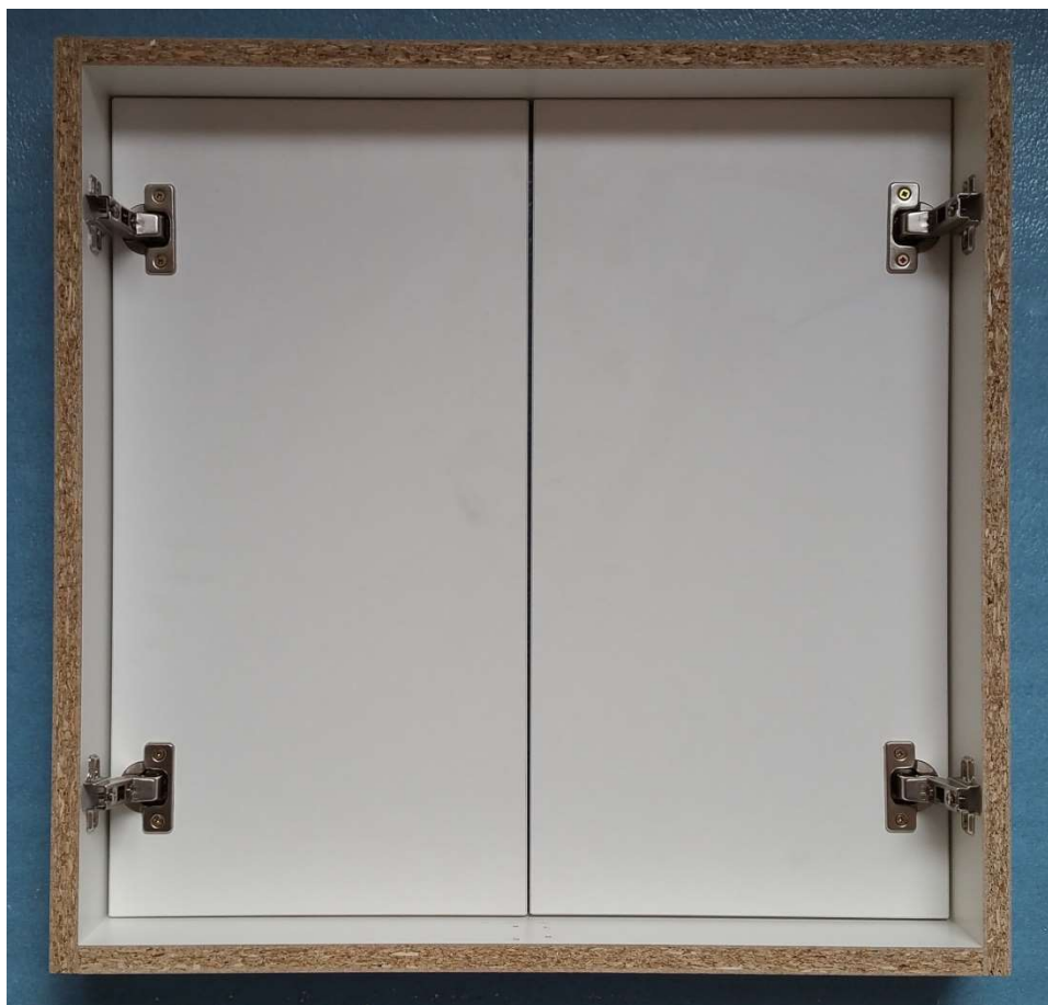
Krok 4 - Osazení dorazů nebo zavíračů Tip on