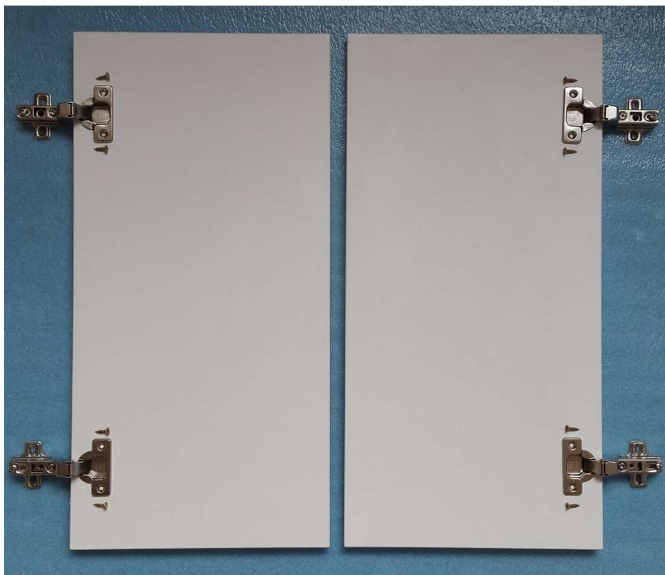
Krok 3 – Zkompletování a seřízení